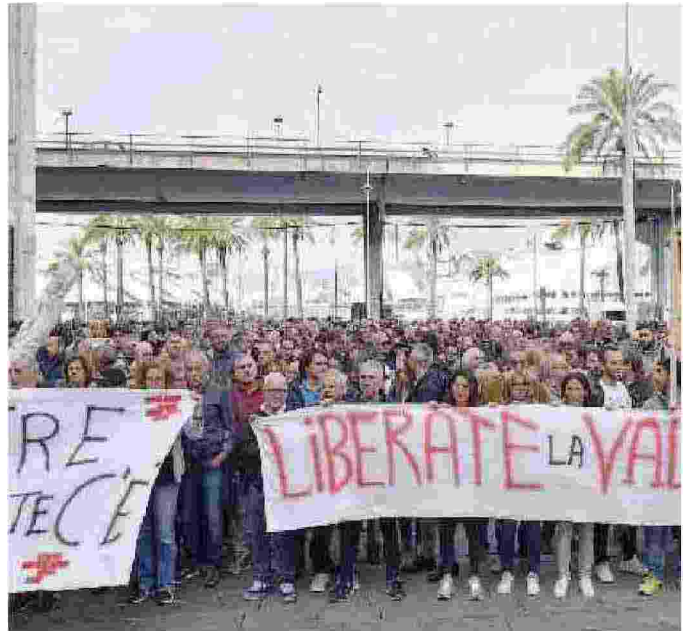
Una manifestazione degli abitanti della Valpolcevera

Partner dell'iniziativa sono anche "Communitas" la Onlus del Consiglio Nazionale dell'Ordine dei Dottori Commercialisti e degli Esperti Contabili (su cui saranno canalizzate le donazioni) e Banca di credito cooperativo di Cherasco che con la sua filiale di Genova gestirà i flussi in entrata sul conto corrente dedicato. ALE.PIE. —