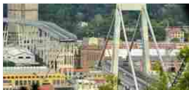
I resti del ponte Morandi

Genova - L'Ordine dei dottori commercialisti e degli esperti contabili di Genova ha lanciato una raccolta fondi per i familiari delle vittime del crollo del ponte Morandi, gli sfollati e le aziende colpite.